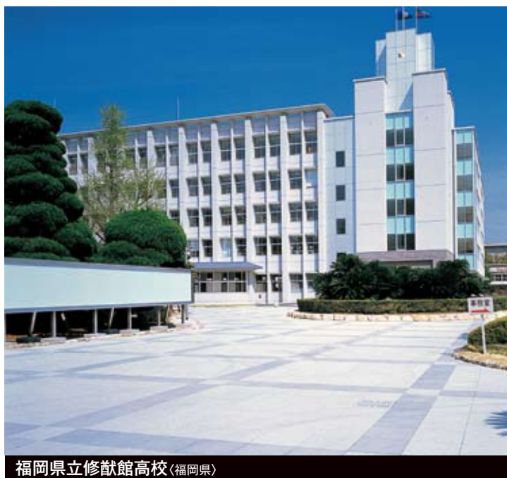
福岡県立修猷館高校(福岡県)

※自然石使用のため品種によって納期に時間がかかる場合があります。 ※右記以外の種石、サイズ、厚みに関しては、当社営業担当までお問い合わせください。