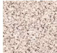
舞鶴ライトイエロー