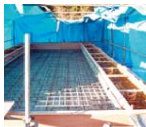
頂版部に配筋を行ない、頂版コンクリートを打設する。