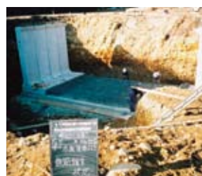
基礎砕石敷設後、均しコンクリートを打設する