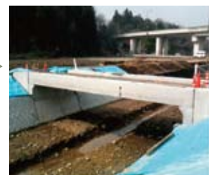
支保工撤去後完成。