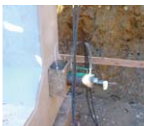
PCより線による縦締めをおこなう。