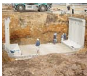
側壁部材を設置する。