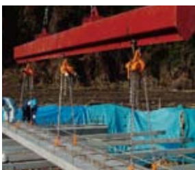
支保工を設置し頂版スラブを架設する。