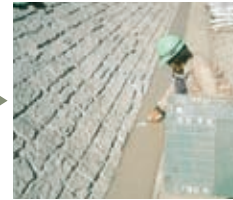
5 埋戻コンクリート