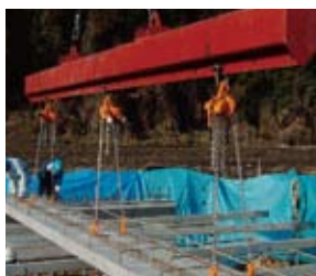
支保工を設置し頂版スラブを架設する。