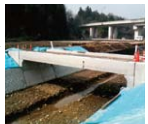
支保工撤去後完成。