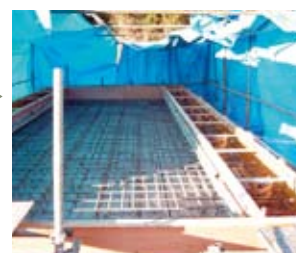
頂版部に配筋を行ない、頂版コンクリートを打設する。