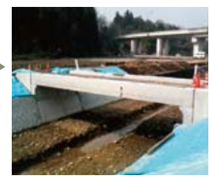
支保工撤去後完成。