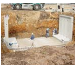
側壁部材を設置する。