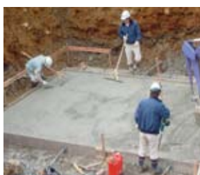
基礎砕石敷設後、均しコンクリートを打設する。