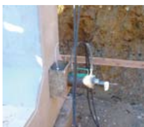
PCより線による縦締めをおこなう。