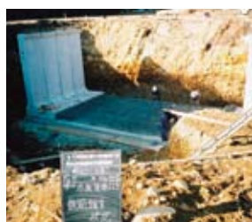
基礎砕石敷設後、均しコンクリートを打設する