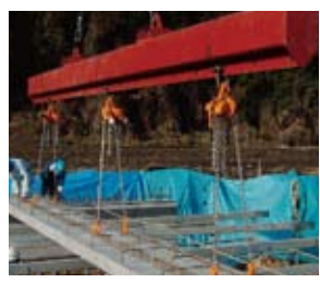
支保工を設置し頂版スラブを架設する。